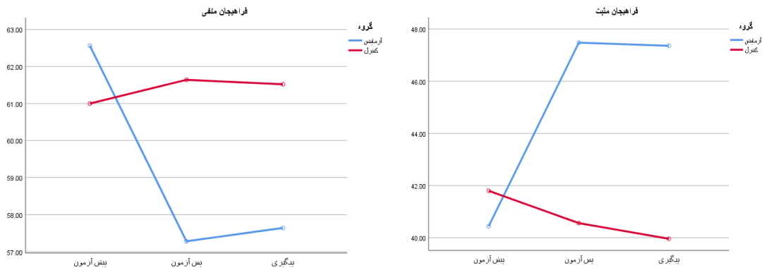
شکل ۲. نمودار میانگین‌های گروه‌های آزمایش و گواه در سه مرحله (فراهیجانان)

با توجه به جدول ۱ و شکل ۱، در متغیر سوگیری تفسیری میانگین گروه آزمایش در پس آزمون و پیگیری به صورت معنی‌داری کمتر از مرحله پیش‌آزمون است ( P < 0/01 )، در حالی که تفاوت بین پس آزمون و مرحله پیگیری معنی‌دار نیست ( P > 0/01 ). اما در گروه گواه تفاوتی بین پیش‌آزمون، پس‌آزمون و پیگیری وجود ندارد ( P > 0/01 ). همچنین با توجه به جدول ۱ و شکل‌های ۲، در مؤلفه فراهیجان مثبت میانگین گروه آزمایش در پس آزمون و پیگیری به صورت معنی‌داری بیشتر و در مؤلفه فراهیجان منفی کمتر از مرحله پیش‌آزمون است ( P < 0/01 )، در حالی که تفاوت بین پس‌آزمون و مرحله پیگیری معنی‌دار نیست ( P > 0/01 ). اما در گروه گواه تفاوتی بین پیش‌آزمون، پس‌آزمون و پیگیری وجود ندارد ( P > 0/01 ). این یافته بدان معنی است که کارگاه یک روزه مبتنی بر درمان رفتاری شناختی نه تنها منجر به بهبود سوگیری تفسیری و فراهیجانان بانوان مبتلا به اختلال افسردگی پیرازایمان در گروه آزمایش شده است، بلکه این تأثیر در مرحله پیگیری نیز پایدار بوده است.